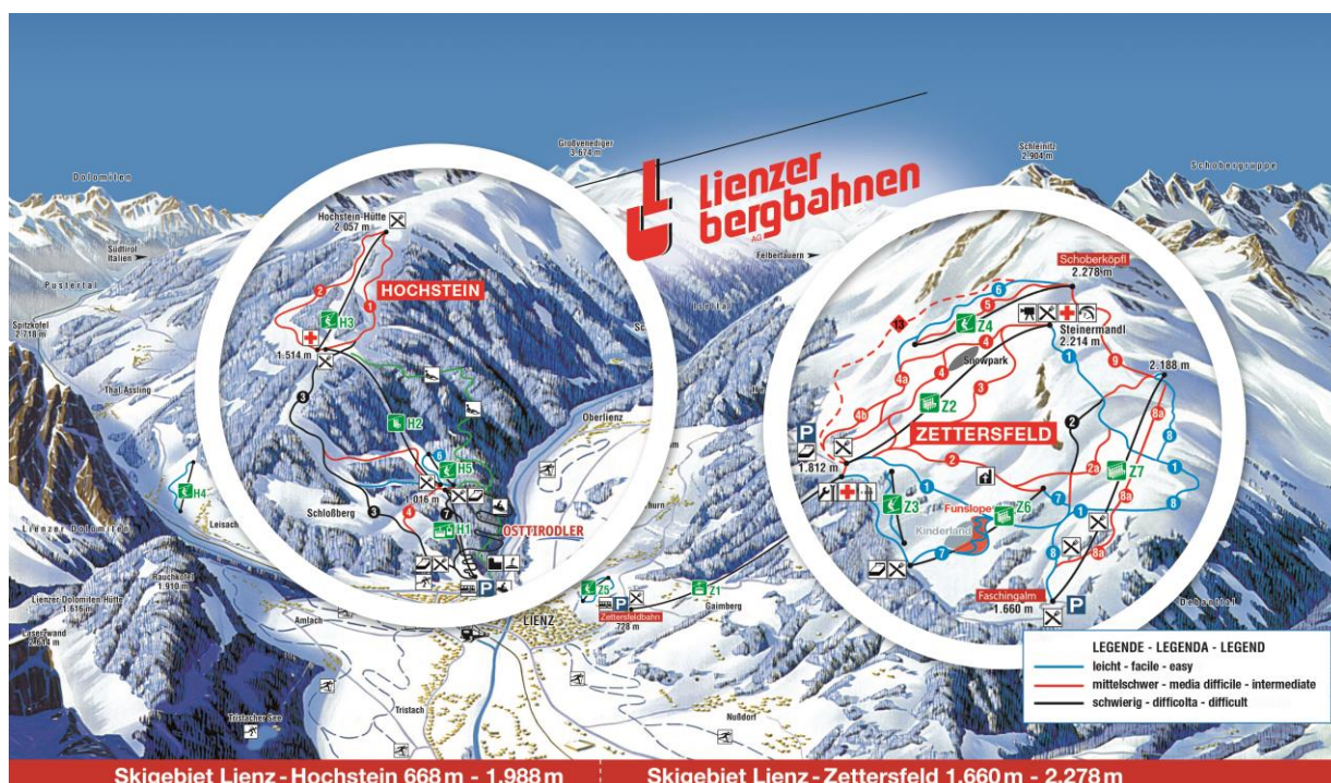
Skigebiet Lienz - Hochstein 668 m - 1.988 m